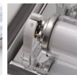
Lâmpadas e suportes Especiais.