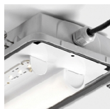
Detalhe do LED