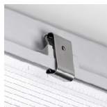
Clips em aço inox