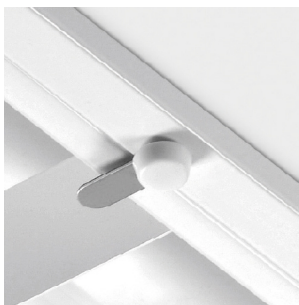
Proteção adicional para refletor

Reservamos o direito de fazer possíveis alterações técnicas sem aviso prévio. Dados eléctricos/ópticos estão sujeitos a uma tolerância de +/-10%.