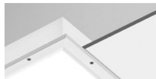
THE, CHE y LNE IP (abajo)