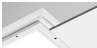
AVT LED, AVT e AVP (Encastre superior)