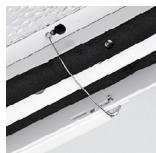
Filin de sécurité