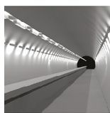
Realização de estudos lumínicos para túneis