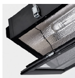
Aro em alumínio e fechos para fácil manutenção