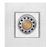
Versión sin marco