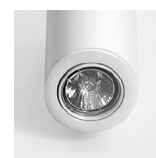
Detalle de la lámpara