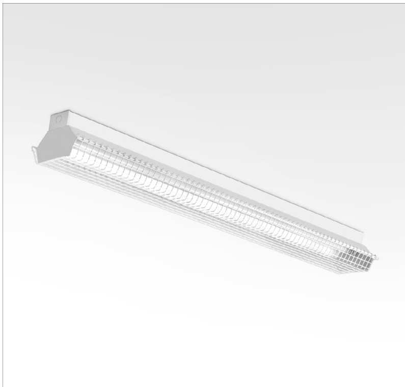
ACR - Reflector simétrico en acero con rejilla de protección

Acabado: Pintado en epoxi-poliéster blanco mate (RAL9016).