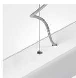
Detalhe de suspensão