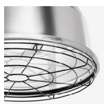
Grelha de proteção como opção