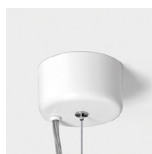
Détail de la patère