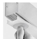
Difusor con sistema Clip-in