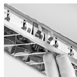
Óptica con sistema Clip-in