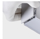
Embouts sans vis