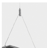
Suspensão Tipo "Y"