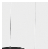
Suspensão Tipo "I"