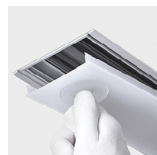
Difusor com sistema Clip-in