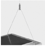
Suspension Type "Y"