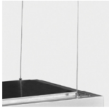
Suspension Type "I"