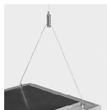
Suspensão Tipo "Y"