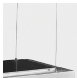
Suspensão Tipo "I"