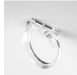
Abrazadera en acrílico