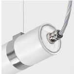
Prensaestopas metálico para versión DS/DALI