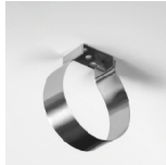
Abrazadera básica en inox