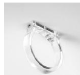
Abraçadeira em acrílico