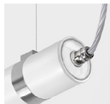
Bucim metálico para versão DSI/DALI