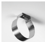
Abraçadeira em inox