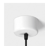
Détail de la patère

Exemple code commande: 90231.L101.E (CODE COM.) + W (COULEUR/FINITION) + 5700 (OPTIONS)