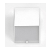
Detalhe do difusor em policarbonato opalino